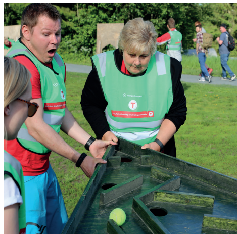
Klart det går, med Erna!

Vi tilbyr mange ulike typer turer og aktiviteter, som dags- og kveldsturer og overnattingsturer i bynære områder og på fjellet. Vi har aktiviteter tilrettelagt for utviklingshemmede og funksjonshemmede i ulike aldersgrupper. Alle aktivitetene i DNT tilrettelagt drives av lokale turistforeninger og turlag.