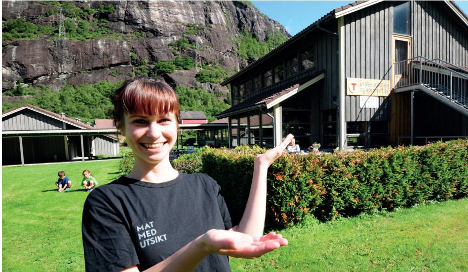
Mange hytter er tilpasset ulik bruk, og er lett tilgjengelige.

Dette gjør vi gjennom tilrettelagte turer og arrangementer, samt at vi jobber for at flere av våre hytter skal være mer tilgjengelige.